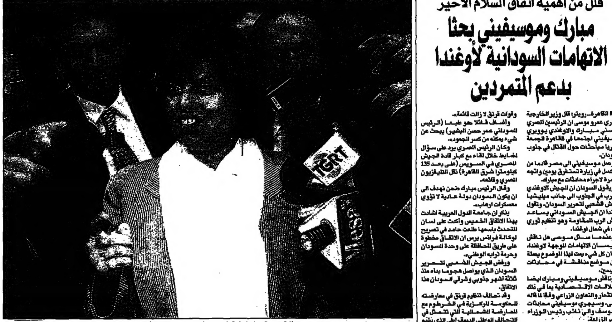
بائية رئيس الوزراء التركية تاشاو تسيلر تحدث للمصافحين امين

نيس أبابا - أفيد أعلنت منظمة الوحدة الإفريقية الخميس انها قررت تخصيص مبلغ 430 ألف دولار من صندوقها للمساعدة على تحقيق المصالحة الوطنية في الصومال. وأوضح بيان للمنظمة ان القرار اتخذته اسم في نيس أبابا مقر منظمة الوحدة المتحدة السفراء الذين يمثلون الدول الأعضاء وذلك في ختام الاجتماع العادية العادية والثلاثين للهيئة المركزية لرابطة تدارك وضع النزاعات. وبحث خلال الدورة موضوعات منها مشروع المصالحة في الصومال، غير ان المؤتمر الوطني عقد في انجوليا في نهاية 1996 بقيادة من الحكومة الاتحادية بناء على ترضيخ من السلطة الحكومية للاختصاصية والمنظمة الوحدة الإفريقية. وكان 26 فصلا صوماليا قد اشتركت في المصالحة الوطنية (نيسابا) للناخبين اقتطعت. غير ان المؤتمر الوطني الموحّد - التحالف الوطني الصومالي وهو فصل يترجمه حسين محمد عبيد الذي يعتبر نفسه رئيسا للصومال لم يشارك في اجتمعات هذه الفصائل التي عقدت في سويدبي على بعد 200 كلم من نهر في هذه الافواض حكومة أرض الصومال وهي منطقة تقع شمالي الصومال أعلنت استقلالها سنة 1991 ورأسها محمد إبراهيم باخان. واتلفت الفصائل الكلا في مقديشيو في 5 نيسان (أبريل) الجاري على عقد مؤتمر لخبر للمصالحة الوطنية في بوساسو (الصومال) في 10 حزيران (يونيو) المقبل، وسيتولى هذا المؤتمر تعيين برلمان انتقالي يقف بأعداد متناسبة لتتقاني لحكم الصومال في انتظار اجراء انتخابات ديمقراطية.